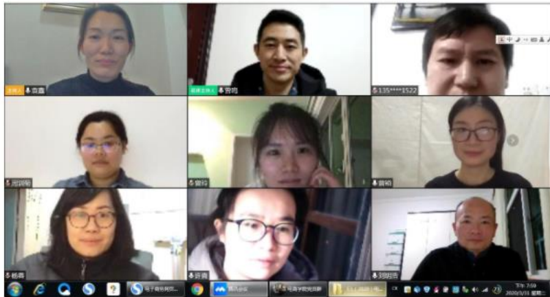
图 1 项目团队进行线上教学研究

2020 年上半年，新冠疫情突然来袭，给天猫新零售现代学徒制项目推进带来了极大困难。根据学校要求，项目组组织了学徒班学员线上、线下学期，在做好疫情防控的同时，积极开展天猫校园店运营，既保障了学习的继续进行，又为学校开学后学生老师的正常生活提供了物质保障和便利，做到了学习和抗疫两不误。