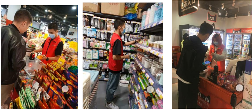
图 3 开学后学徒班学员在基地学习工作

根据学校严格落实省委省政府和教育部、教育厅的重要部署，保障“停课不停教、停课不停学”的安排，结合学校实际，项目组于3月30日开展在线教学。项目组在2020年3月29日学校学徒制项目推进会的精神下，正式开展线上学习。本学期的课程是《新零售线上运营》，老师带领同学首先开展了新零售线上运营的理论学习，并对天猫新零售“猫超校园店”微信公众号后台进行熟悉，为新学期“猫超校园店”微信公众号的运营作好了准备。