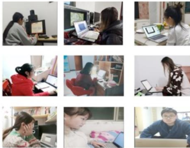
图 2 学徒班学员进行线上学习

根据学校严格落实省委省政府和教育部、教育厅的重要部署，保障“停课不停教、停课不停学”的安排，结合学校实际，项目组于3月30日开展在线教学。项目组在2020年3月29日学校学徒制项目推进会的精神下，正式开展线上学习。本学期的课程是《新零售线上运营》，老师带领同学首先开展了新零售线上运营的理论学习，并对天猫新零售“猫超校园店”微信公众号后台进行熟悉，为新学期“猫超校园店”微信公众号的运营作好了准备。